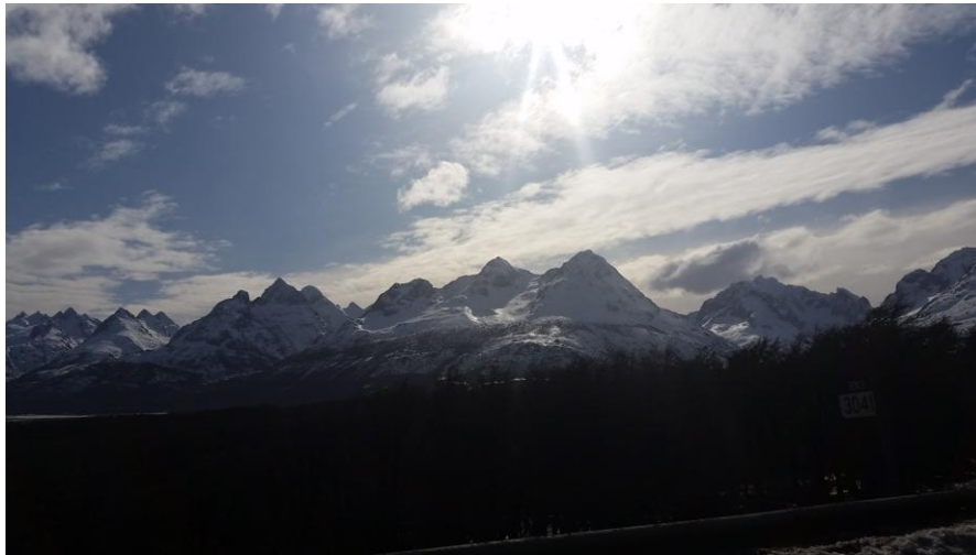
Cerro Castor hegyei

A szervezők mindent megtettek azért, hogy a sípályát, ahol a fő bemutatók voltak még alkalmasabbá tegyék erre a célja. A pálya meghosszabbítása érdekében alagutat építettek a közút fölé. A pálya mellé pedig egy külön lift került a tavalyi évben.