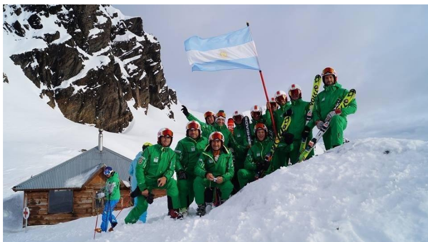
Magyar delegáció tagjai a csúcson