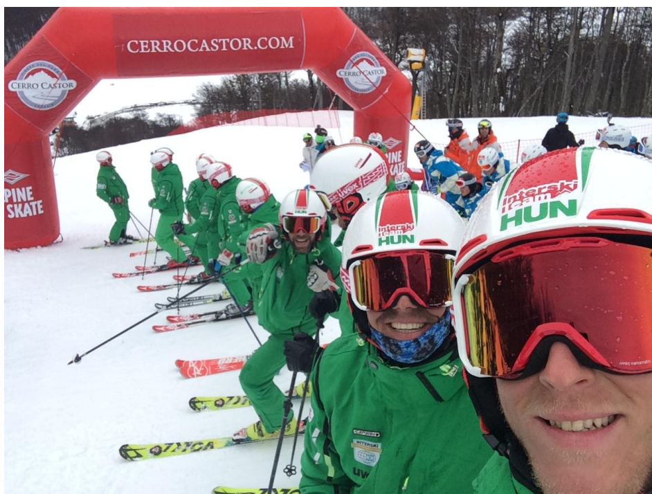
Democsapat a megnyitón a rajtban