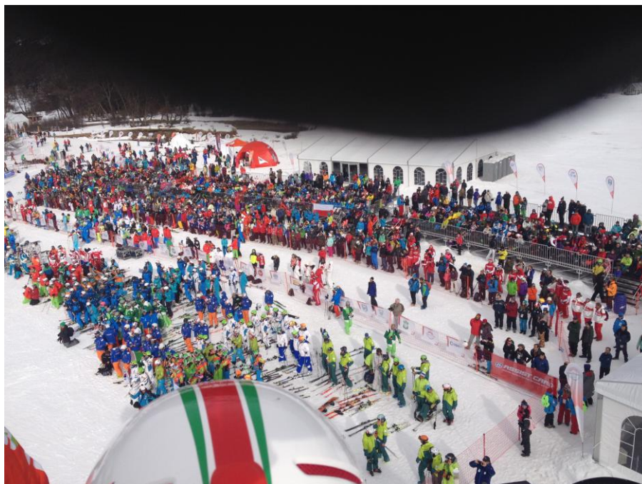
Csapatok a megnyitón