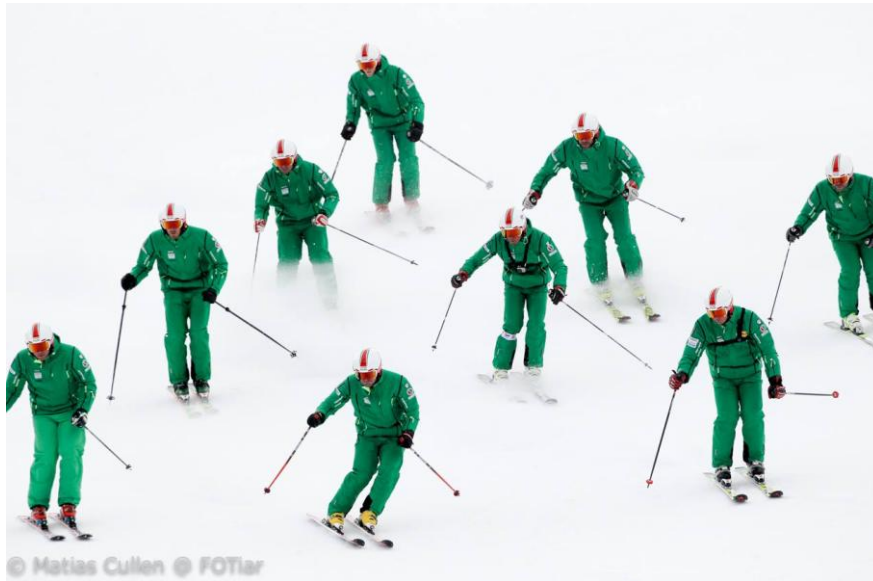
Magyar formáció a bemutatón

A bemutatóra egy 9, egy 8 és egy 6 fős koreográfiával készült a democsapat. Ezen felül volt egy technikai menet, amelyben mi a rövidlendületek különböző végrehajtási formáit mutattuk be. Új eleme volt a bemutatónak az ún. összehasonlító menet, ahol minden ország ugyanazt a feladatot síelte egy lesiklás alatt: karcolt hosszúlendület, karcolt rövidlendület és karcolt rövidlendület versenytempóban. A megnyitón és a záróünnepségen minden ország egy-egy menettel szerepelt. Erre az alkalomra a nem demos delegációtagok is beálltak a formációba és egy három oszlopos rövidlendületes „árnyékban” megsíelt formációt mutattak be (egyidejűleg mindenki ugyanabba az irányba fordul, ugyanabban a ritmusban).