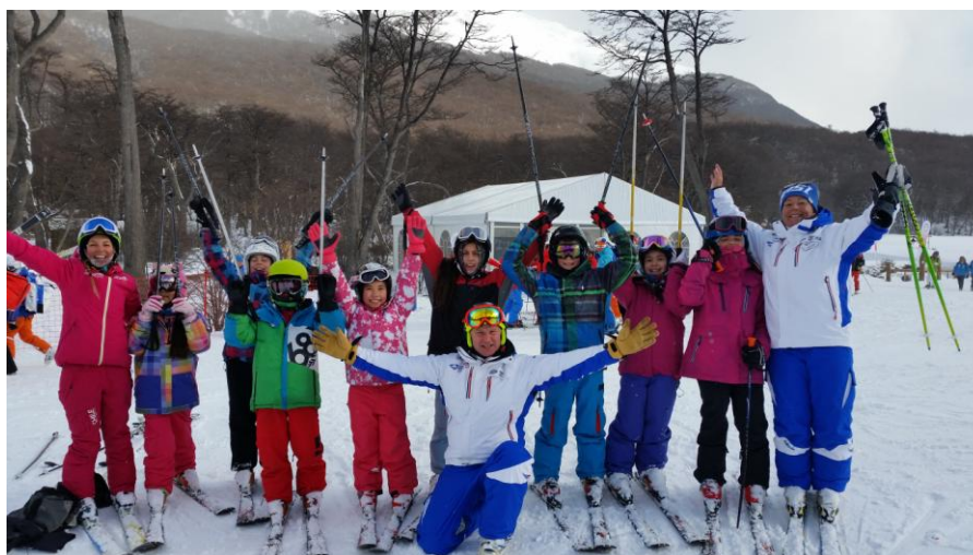
Interski Ski-school angol oktatókkal

Az átlagos napirend a következő volt: utazás Cerro Castorba, a pályán naponta 6-7 ország formációs és technikai bemutatója, gyakorlati foglalkozások a havon a havas sportok minden ágában (un. workshopok, ahol a résztvevő országok képviselői csoportokat alkotva egy-egy gyakorlatvezetővel a pályán sielve dolgozzák fel az adott témát), Interski Skischool, melynek keretében 60 argentin kisiskolás gyerek kapott naponta oktatást különböző nemzetiségű síoktató segítségével, síoktatók síversenye, utazás vissza a városba, délutáni kiselőadások (összesen 14/nap), este nagyelőadások, közgyűlések és a következő kongresszus megrendezésére jelentkező országok bemutatói. Sajnos nappal a közös beszélgetésekre nem igazán maradt idő, így a nemzetközi kapcsolatépítés az Interski bárban folyt esténként.