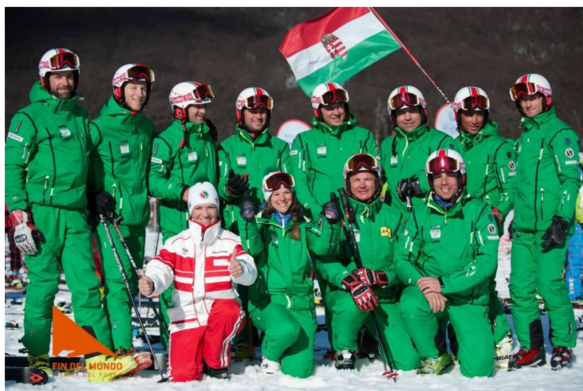
Hungarian Interski Team 2015

A Sioktatók Magyarországi Szövetsége 1991 óta tagja az Interski International szervezetének . Felvételünk óta minden kongresszuson jelen voltunk és sikerrel szerepeltünk. Ez volt a hetedik kongresszus, amelyen magyar delegáció részt vett. Szeptemberben a déli félteke legdélebbi városában az argentin Ushuaiában 13 fős csapat képviselte a magyar síoktatókat.