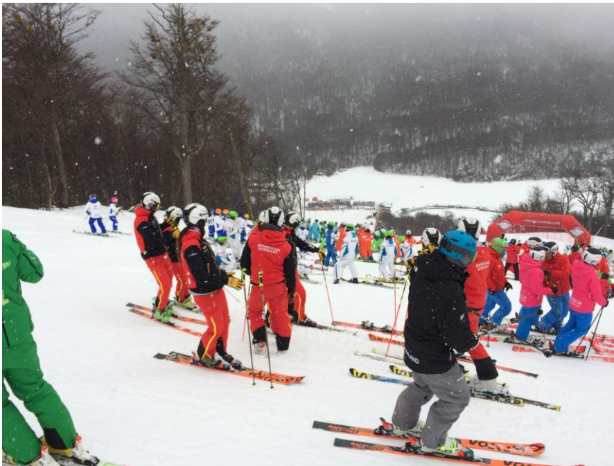
Demopálya a rajtból

A szervezők mindent megtettek azért, hogy a sípályát, ahol a fő bemutatók voltak még alkalmasabbá tegyék erre a célja. A pálya meghosszabbítása érdekében alagutat építettek a közút fölé. A pálya mellé pedig egy külön lift került a tavalyi évben.