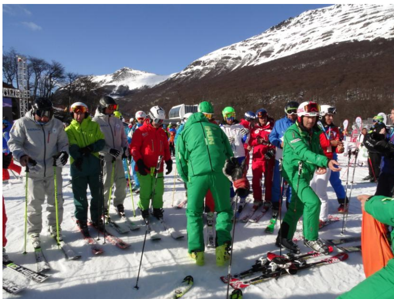
3.sz. foto magyar workshop - gyülekező

A kiselőadásba beépültek a kifejezetten síiskolás síoktatóknak tavasszal tartott továbbképzésen gyűjtött felmérési adatok, továbbá három, e témában írt egyetemi diplomadolgozat megállapításai, melyek alapján az előadók megállapításokat tettek a magyar jellemzőkről 4 témakörben. Ezek a síoktató személyiségére, a feladatok jelenkori átstrukturálódására és az animációs szerep megerősödésére, a sísport környezettel való kapcsolatára és szakmai kompetenciák mérésére irányultak. A kiselőadásunkra több mint 30 fő volt kíváncsi (miközben egyidőben párhuzamosan 6 másik kiselőadás zajlott).